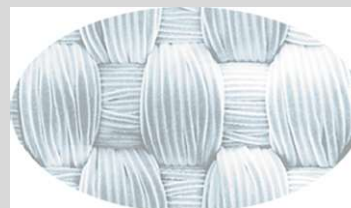
Dacron Gamme SF