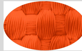
Dacron Gamme SF

« Le tourmentin est un foc de tempête. C'est le plus petit foc d'un voilier. Cette voile, réalisée en tissu très épais, est conçue pour résister au gros temps. Lorsqu'elle est utilisée seule, elle maintient le bateau aux allures de fuite. »