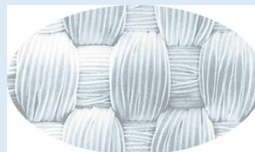
Dacron gamme SF